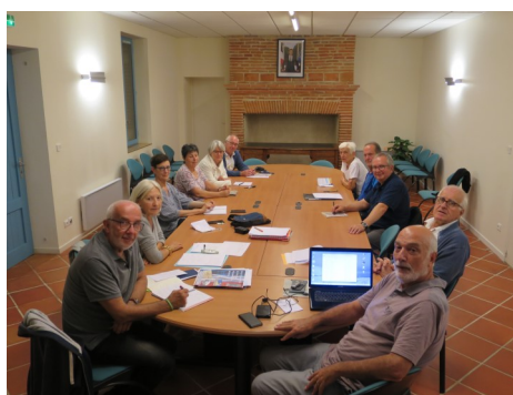
L'équipe de préparation en réunion à Pin Balma