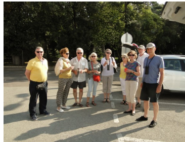
Notre sortie de juillet dans le Lauragais audois

Sollicitée par les enseignantes de l'école élémentaire de Flourens, et par le CAJ, l'association interviendra auprès des jeunes flourensois pour parler du patrimoine local.