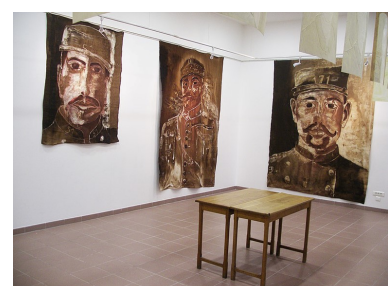
Tentures murales d'Eric Plateau

Ces expositions seront ouvertes le vendredi 9 aux enfants des écoles et pour le public le samedi et le dimanche 11 toute la journée.