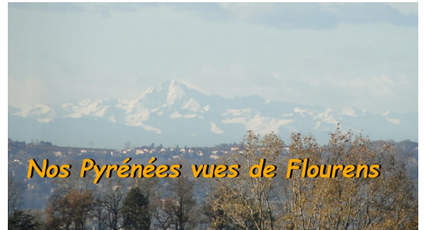
Un magnifique paysage vu en ce début d'année

Que l'année 2018 soit pour chacun le théâtre de belles réalisations et pour tous l'occasion de fructueuses coopérations.