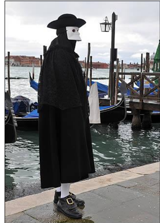
Costume appelé la bauta